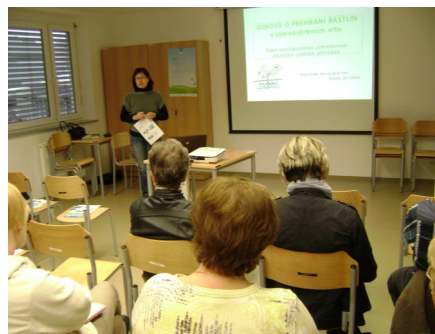
Osnove o prehrani rastlin v samooskrbnem vrtu