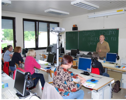
Starejši brskamo in nakupujemo po spletu