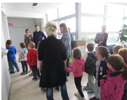
Dan odprtih vrat Eti Elektroelement d.d.