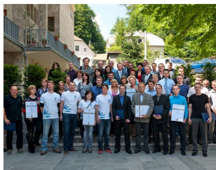
Svečana podelitev priznanj najboljšim inovatorjem Zasavja za leto 2013