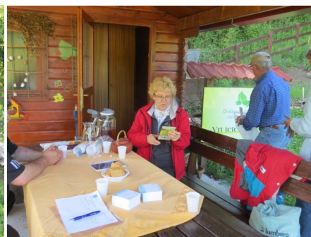
Vrt tete Johance v Europarku