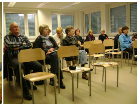
Predstavitve Mountainbike kluba Trbovlje