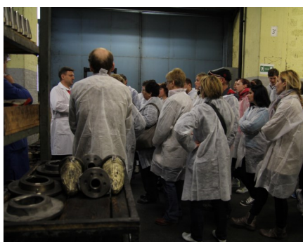
Dan odprtih vrat Steklarne Hrastnik

»Ne učimo se za šolo, marveč za življenje.« - Seneka