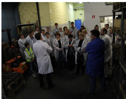
Dan odprtih vrat Steklarne Hrastnik