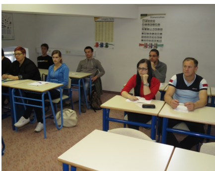
Znam se predstaviti v nemščini