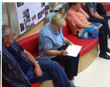
Varčevanje z energijo v gospodinjstvu

»Kdor se učenju posveča, se iz dneva v dan veča.«