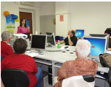
Sedem nasvetov za hitrejše učenje tujega jezika