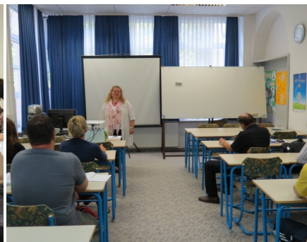
Komunikacija in pravilna slovenščina za vsakdanjo rabo