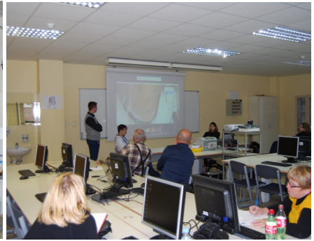
Grafično urejanje v Photoshopu na STPŠ Trbovlje