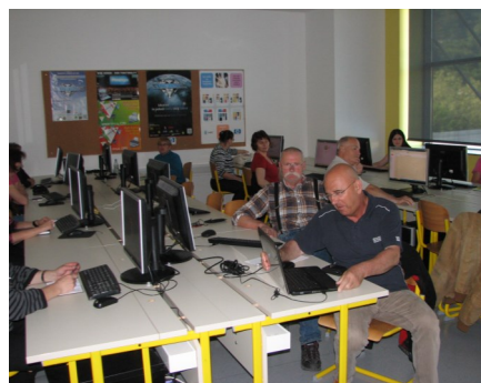
Internet in e-pošta za priseljence