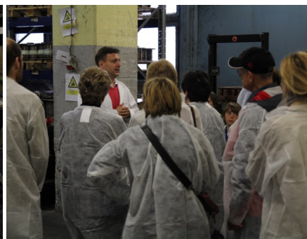
Dan odprtih vrat Steklarne Hrastnik